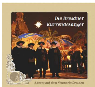
Audio-CD Dresdner Kurrende